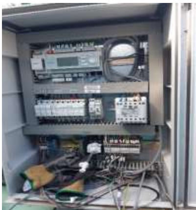
Во DERN работеа :